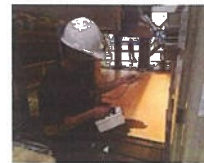
เข้าไปสำรวจปริมาณรังสี