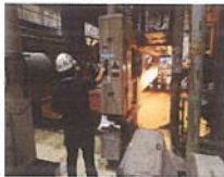
ผู้จัดการแผนกจึงสั่งการให้หัวหน้าหมวด ทำการติดตั้งตัวกั้นครั้งถัดไป