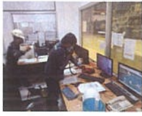
ส่วนผลิตกระแสไฟฟ้า