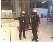
หัวหน้าหม้อไอน้ำเหตุต่อผู้รับผิดชอบ ทางเทคนิค (RSC)