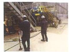
ทำการกำจัดพื้นที่