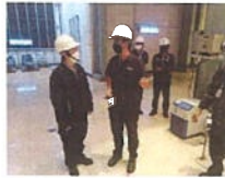
ผู้จัดการแผนก และ ผู้รับผิดชอบ ทางเทคนิค ไปยังที่เกิดเหตุ