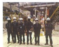
ถ่ายรูปหมู่หลังฝึกซ้อมเสร็จ