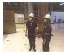
ผู้ควบคุมงานได้สั่งการ