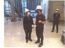
ผู้รับผิดชอบทางเทคนิครายงานต่อหัวหน้าแผนก