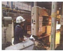
ช่างเทคนิคได้ดำเนินการตรวจสอบ